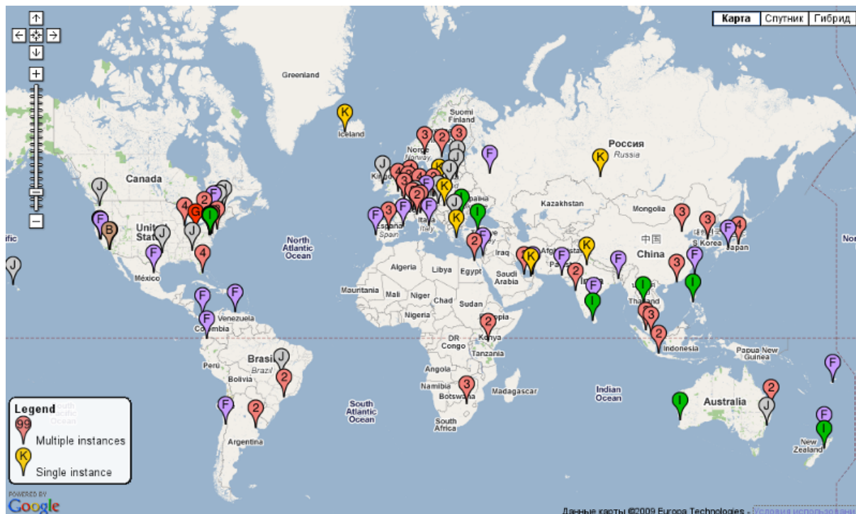
Рис 3 География системы КС ( см. http://www.root-servers.org/ )